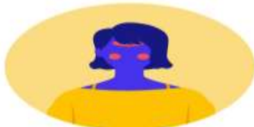
Fiebre sobre 37,8°

Los siguientes síntomas se puede dar juntos, o por separado: