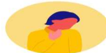
Dificultad para respirar (a diferencia de un resfriado)